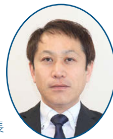
第1事業部 クリニック 部長

2026年5月1日より、あんの循環器・総合クリニックに新たに整形外科の常勤の医師が加わりました。