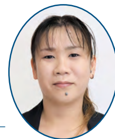
認知症チームリーダー

日本の認知症高齢者数は、2012年462万人と推計されており、2025年には約700万人、65歳以上の高齢者の約5人に1人に達すると見込まれています。認知症は誰もが関わる可能性のある身近な病気です。(厚生労働省 認知症施策推進総合戦略(新オレンジプラン)より) そこで、青藍会グループが取り組む認知症ケアについてご紹介いたします。