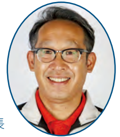
はあとサポート山口 事業所長

地域の皆さまが生活していくうえで、医療・福祉サービスだけではカバーできないお困りごとに寄り添うために、はあとサポート山口は2017年2月に開設しました。